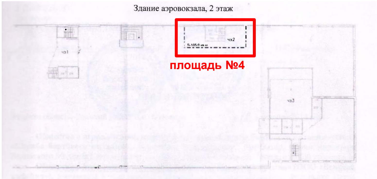
Здание аэровокзала, 2 этаж

Площадь №4, Аэровокзал. 2 этаж. «Стерильная зона» - зал ожидания вылета внутренних авиалиний. S- 105 кв.м.